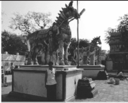
Village deities at Patchai Amman Temple, Thirumullaivoyal