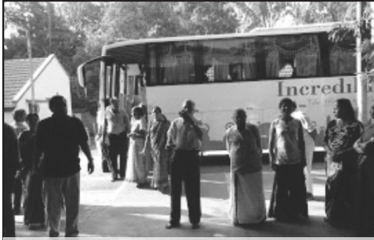
A section of the participants